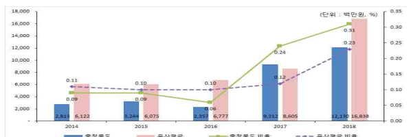
행사·축제경비 비율 유사 지방자치단체와 비교

※ 2018회계연도부터 민간행사사업보조(307-04) 통계목을 포함하여 작성되었습니다.